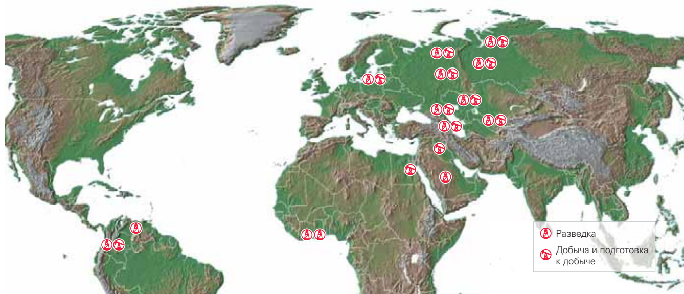
Разведка Добыча и подготовка к добыче